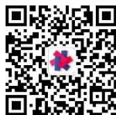
中美友好 互信合作计划