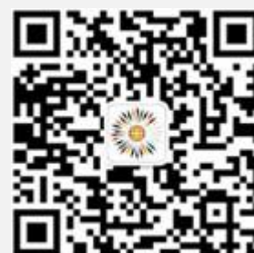
复旦大学中国金融家俱乐部