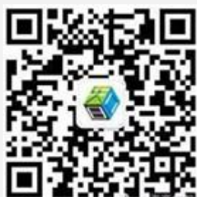
上海高校智库研究和管理中心