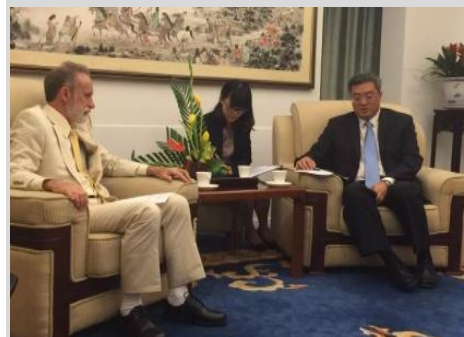
Annual Meeting of the New Champions 2015 Dalian, 9-11 September 新领军者年会 中国·大连