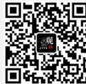
复旦青年政策规划学社