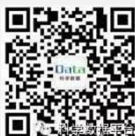
复旦大学社会科学数据平台