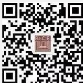
上海高校智库 复旦大学中国经济研究中心 (RICE)